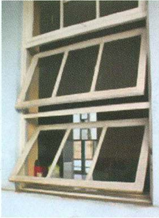
(1) Ventanas y puertas abiertas