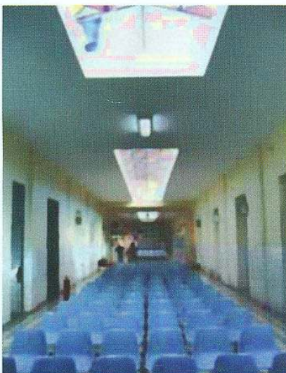
(3) Aberturas de las claraboyas

La ventilación introduce aire exterior en un edificio o una habitación y distribuye el aire dentro del edificio o la habitación. El propósito general de la ventilación de los edificios es sanear el aire que se respira diluyendo los contaminantes que se originan en el edificio y evacuándolos. Para ventilar un edificio se pueden utilizar tres métodos: ventilación natural, ventilación mecánica y la ventilación híbrida.