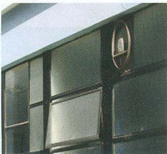
(2) Sistema de extracción